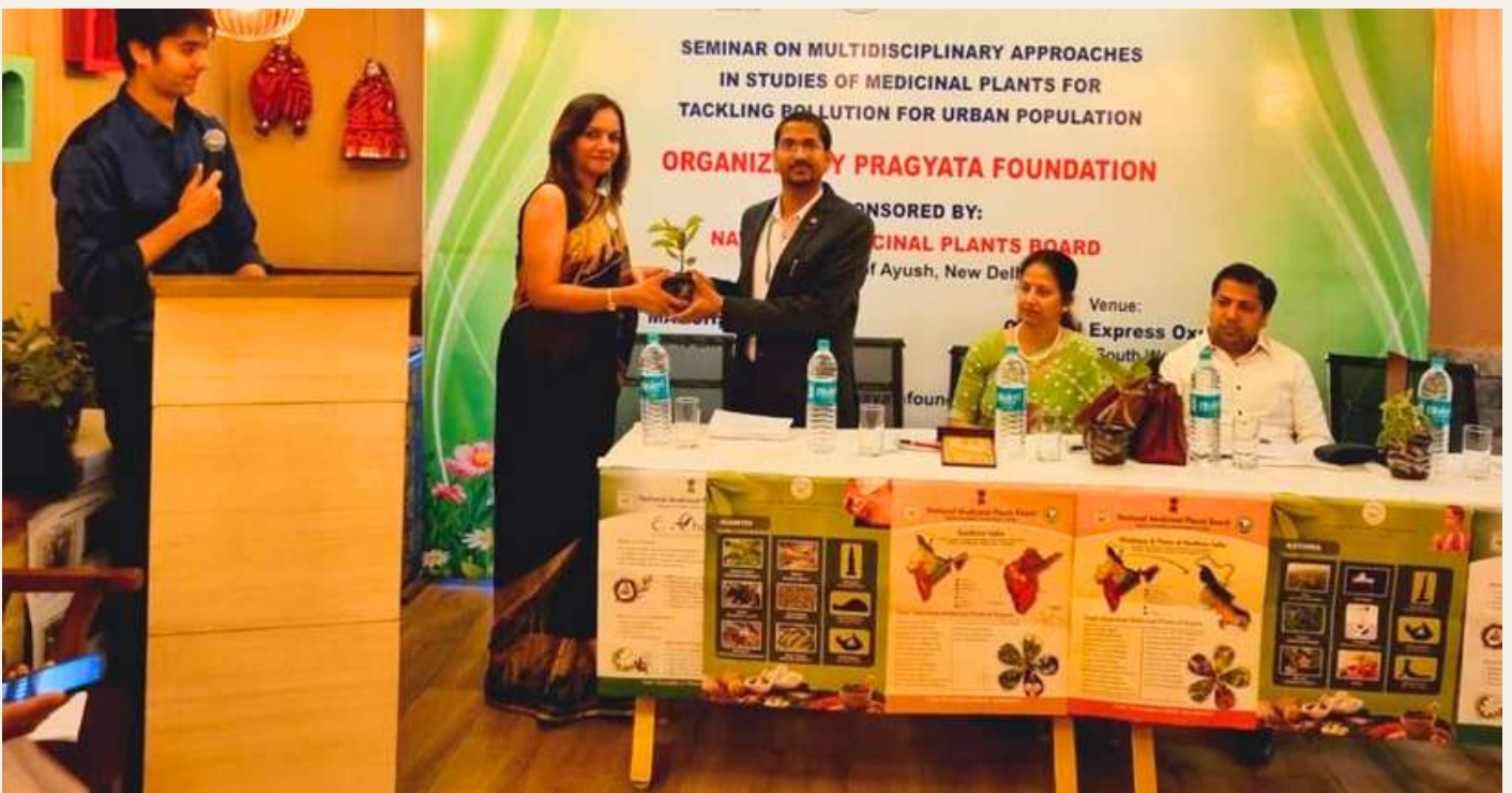
Innaugural ceremony of the seminar by welcome of guests