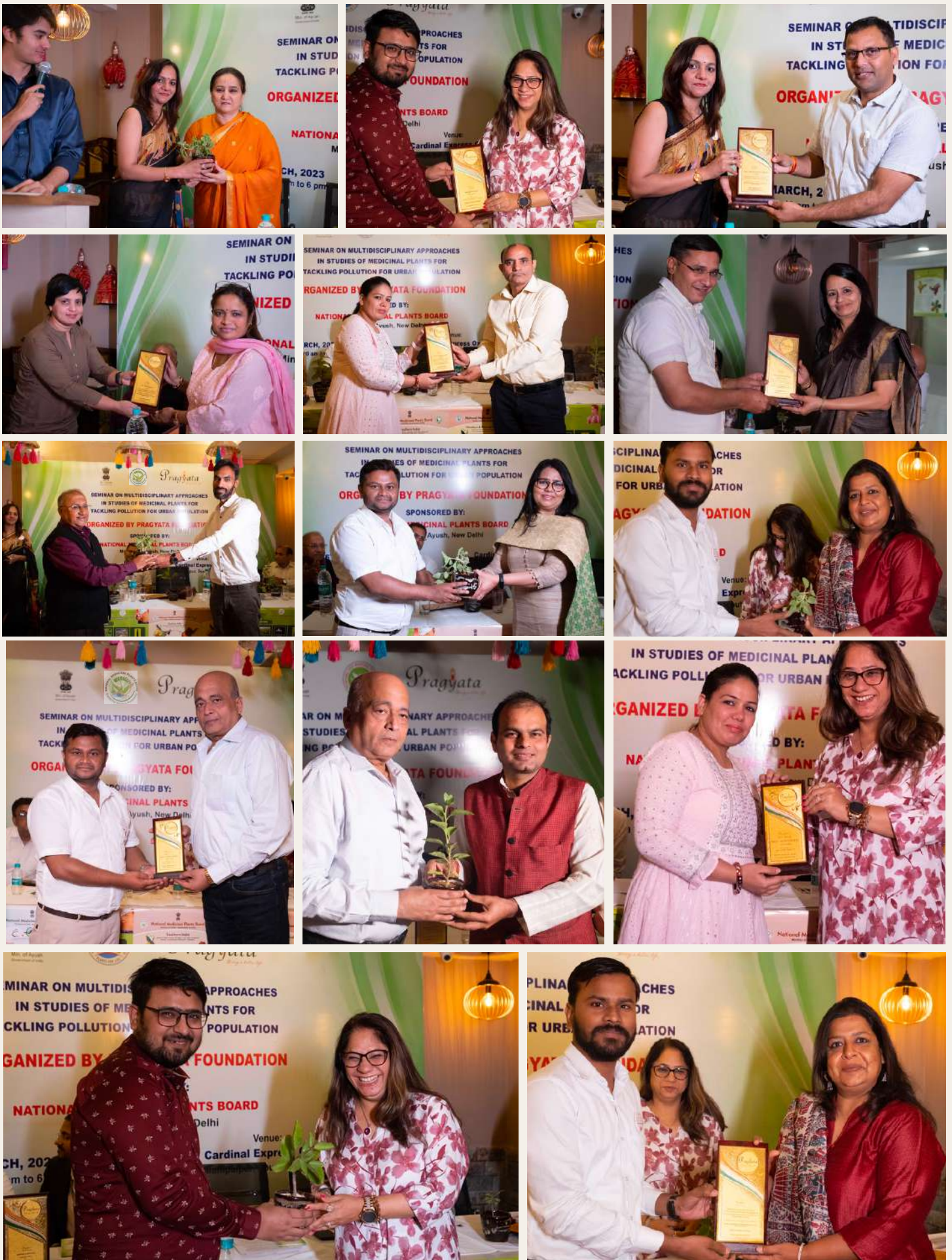
Felicitation of dignitaries and invited speakers