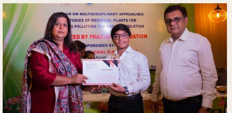
Research competition & Declamation competition winners