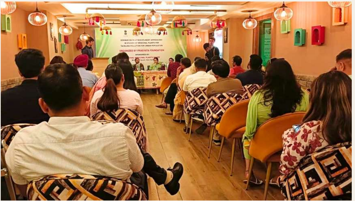
Guests interaction and Question Answer session with participants