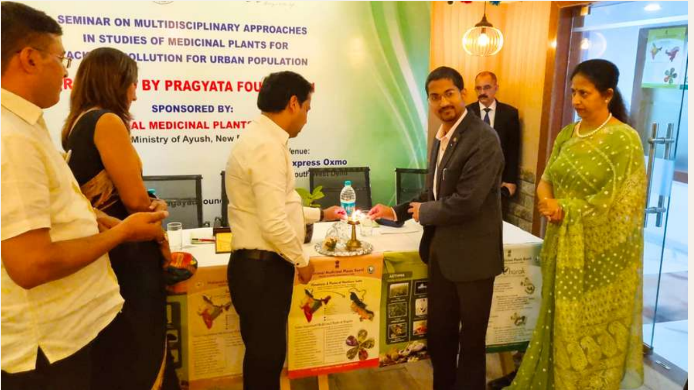
Diya lighting by the Guests