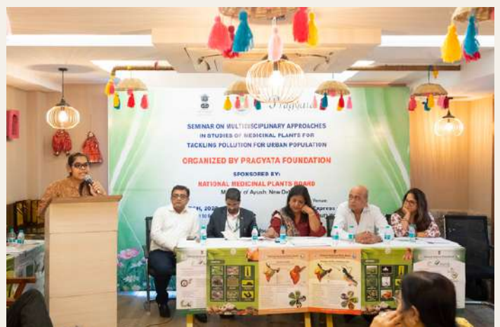
flow of Research competition & Declamation competition