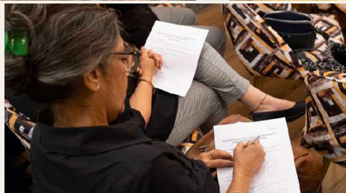
Feedback & Assessment session