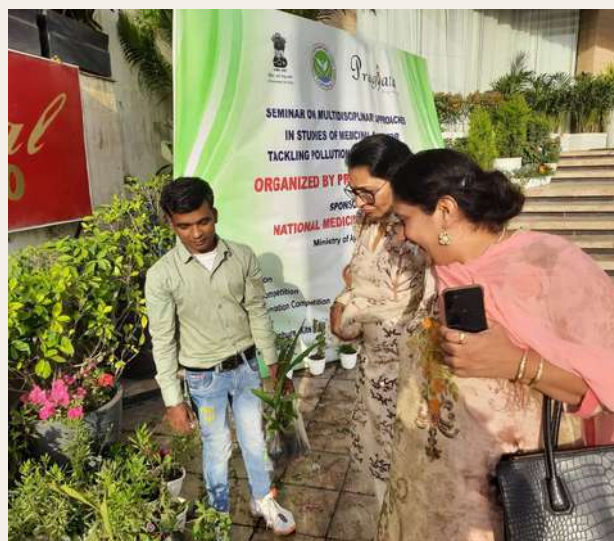
Distribution of Medicinal plants to the participants during the program