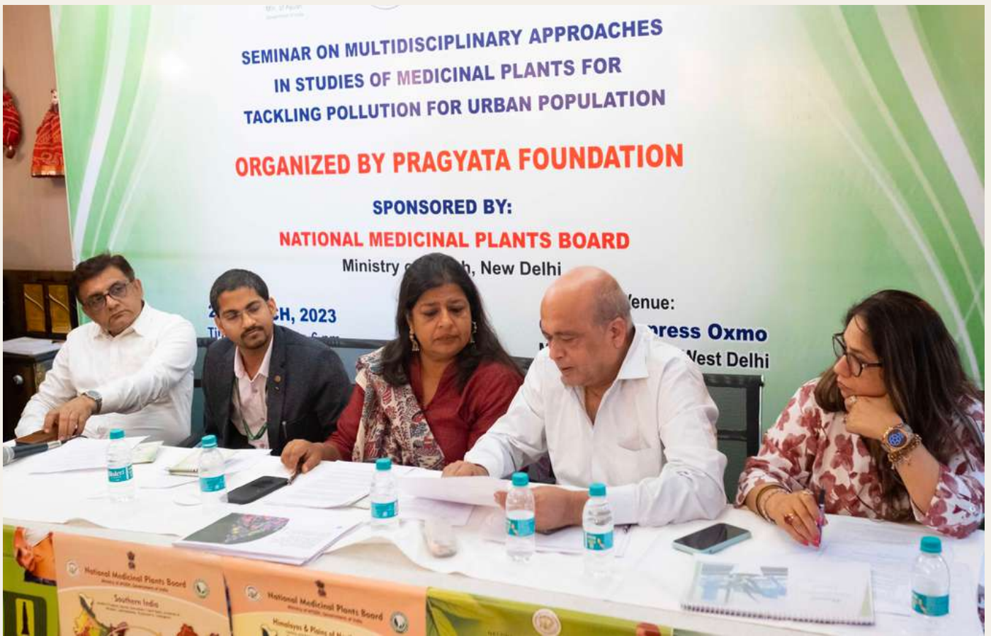
Judges of Research competition & Declamation competition